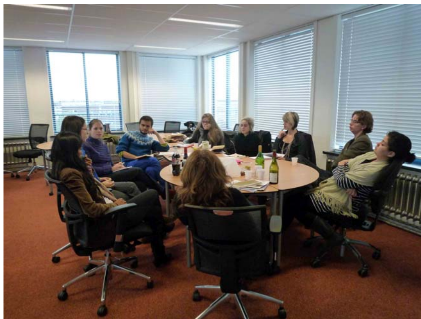
Discussiegroep masterstudenten, 12 nov.

Net als vorig jaar werd er een leesgroepje gevormd van masterstudenten. Dit keer werd gediscussieerd over de ideeën van Baudrillard, Foucault en Susan Sontag.