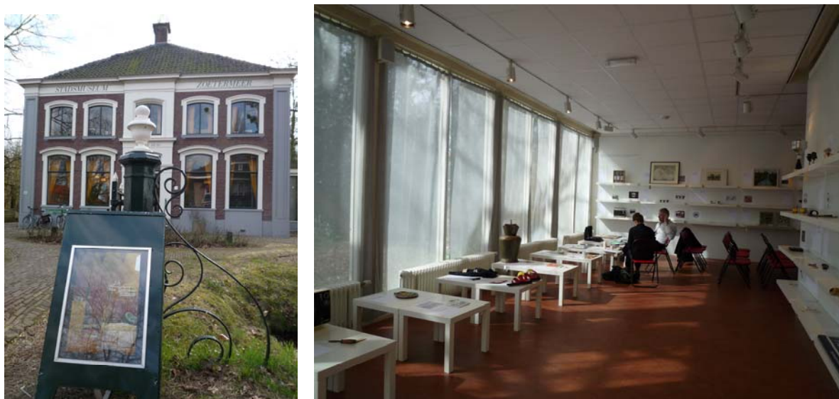
Project De Wonderkamer van Zoetermeer, Stadsmuseum Zoetermeer