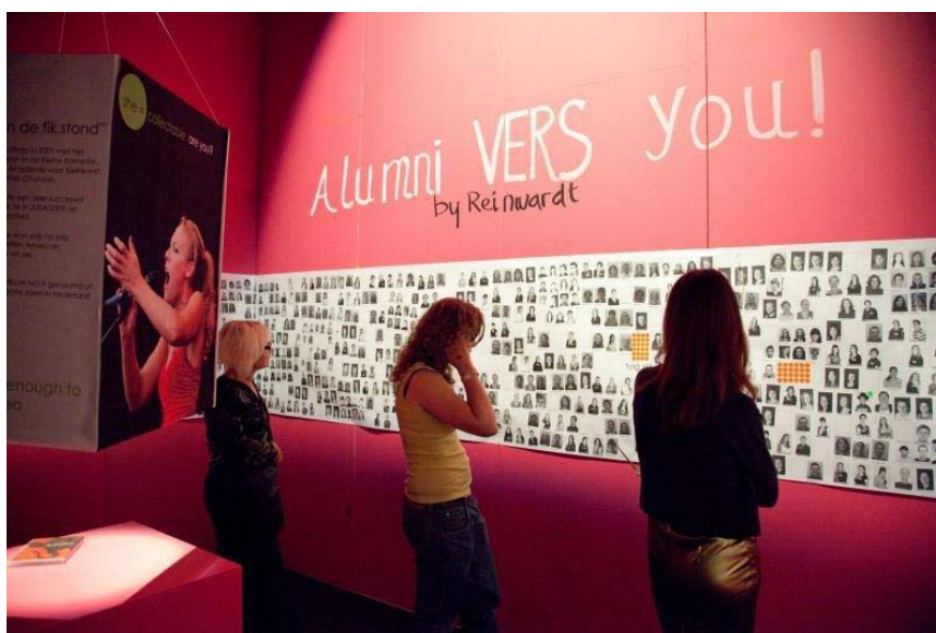
Indruk van de Reinwardt-presentatie tijdens de AHK Vers-manifestatie