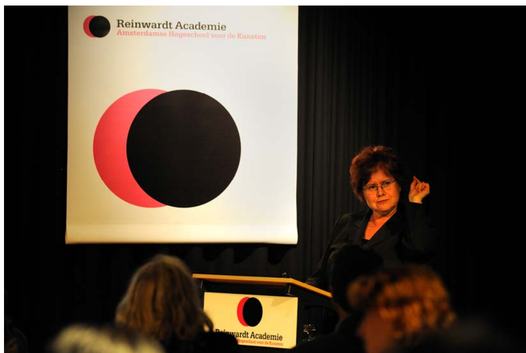
Reinwardt Memorial Lecture, Lynne Teather

Op 3 juni (de geboortedag van Caspar Reinwardt) werd de tweede Reinwardt Memorial Lecture gehouden. Onder de titel “Museology from the frontier: navigating the shifting paradigms of museum study and praxis” gaf de Canadese museologe Lynne Teather een panoramisch beeld van de paradigmatische veranderingen binnen theorie en praktijk van het museumwerk. Om financiële redenen moest de publicatie van de voordracht naar 2010 doorgeschoven worden.