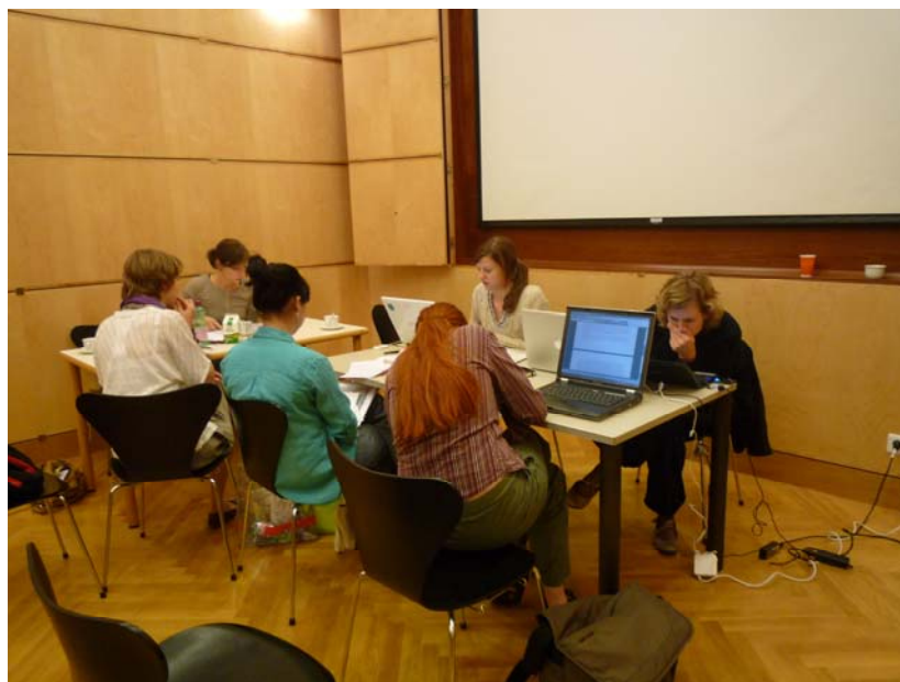
“Schreiblabor” in het Hofmobiliendepot Möbel Museum, Wenen

class” tentoonstellingskritiek in Nederland naar model van eerder genoemde Duits-Oostenrijks-Zwitserse workshops.