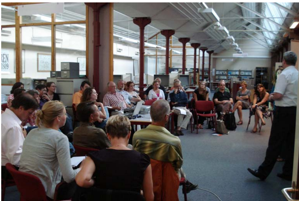
ErfgoedArena op locatie. Discussie “Historische schepen: erfgoed of gebruiksgoed?” in het Regionaal Archief te Tilburg (15 juli)