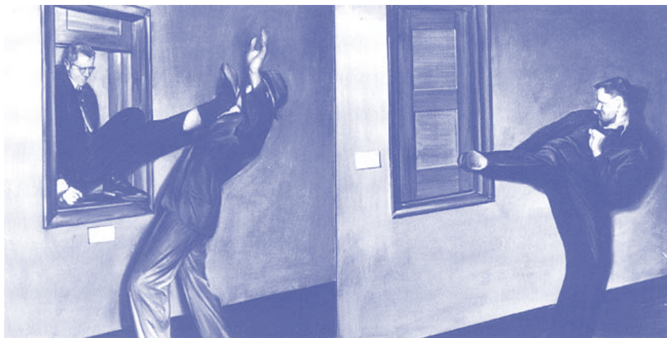
Afbeelding : Mark Tansey, Modernism Postmodernism, 1984