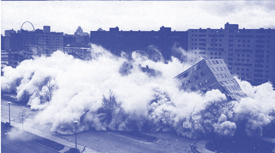
Pruitt-Igoe wooncomplex, 15 juli 1972, 15:52 uur