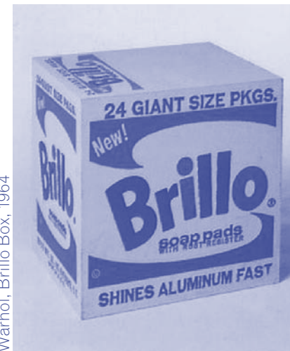
Warhol, Brillo Box, 1964

Leerdoel van de interpretatieve kunstbeschuwing is het kunstwerk te verbinden met meervoudige contexten (interpreteren). De interpretatieve kunstbeschuwing is gebaseerd op de institutionele kunsttheorie. Soms wordt het ook wel postmoderne kunstbeschuwing genoemd. De theorie die hieraan en grondslag ligt is in de jaren 60 van de twintigste eeuw ontwikkeld door o.a. Danto. Hij werd geconfronteerd met objecten die verschijningsvormen hadden van de gewoonste gebruiksvorwerpen en toch kunstobjecten waren.